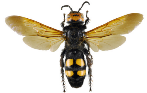
Scolie des jardins, Megascolia maculata flavifrons

La scolie des jardins fait partie des plus imposantes "guêpes" européennes. Elle est de ce fait fréquemment confondue avec le frelon asiatique. Sa pilosité est très épaisse. Son corps est noir brillant, sa tête est jaune sur le dessus et elle possède 4 zones jaunes et glabres sur l'abdomen. C'est un parasite de larves de gros Coléoptères (comme le Hanneton).