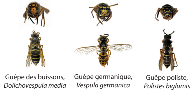
Guêpe des buissons, Dolichovespula media

Les guêpes sont plus petites que les frelons. Les ouvrières mesurent environ 15mm en fin d'été. Attention, une reine de guêpe peut dépasser légèrement 20mm, c'est-à-dire la taille du frelon asiatique représenté ici sans la tête. Au printemps les guêpes peuvent donc être plus grande que les premières ouvrières de frelon.