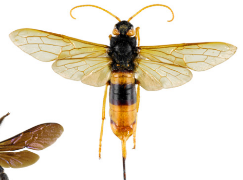
Sirex géant, Urocerus gigas

Le sirex géant est un Hyménoptère dont la larve se nourrit de bois. La femelle peut atteindre 4,5 cm, a une coloration proche du frelon asiatique, mais s'en distingue facilement par des antennes longues entièrement jaunes ainsi que par la présence d'une longue tarière lui permettant de pondre dans le bois. Cet insecte est inoffensif.