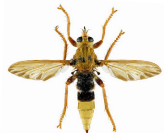
Asile frelon, Asilus crabroniformis