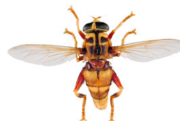
Milésie faux-frelon, Milesia crabroniformis