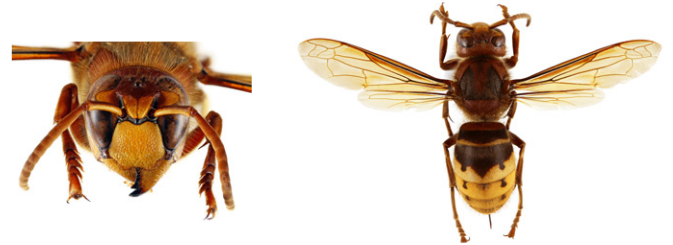
Frelon d'Europe, Vespa crabro

Le frelon d'Europe , Vespa crabro , a l'abdomen à dominante jaune clair, avec des bandes noires. Sa tête est jaune de face et rouge au dessus. Son thorax et ses pattes sont noirs et brun-rouges. Les ouvrières mesurent entre 18 et 23mm et les reines entre 25 et 35.