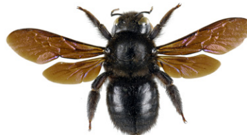
Xylocope ou abeille charpentière, Xylocopa violacea

L' abeille charpentière mesure entre 2 et 3 cm. C'est l'une des plus grandes abeilles européennes. Elle est entièrement noire avec des reflets bleu violacés. Elle construit son nid dans le bois mort et nourrit ses larves de pollen.