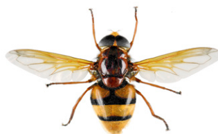
Volucelle zonée, Volucella zonaria

De nombreuses mouches (Diptères) peuvent ressembler à des guêpes ou des frelons. Mais à la différence de ceux-ci elles ne possèdent qu'une seule paire d'ailes au lieu de deux. Leurs yeux sont généralement beaucoup plus globuleux et leurs antennes plus courtes.