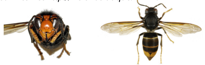
Frelon asiatique à pattes jaunes, Vespa velutina

Le frelon asiatique à pattes jaunes, Vespa velutina , est à dominante noire, avec une large bande orange sur l'abdomen et un liseré jaune sur le premier segment. Sa tête vue de face est orange, et les pattes sont jaunes aux extrémités. Il mesure entre 17 et 32mm.